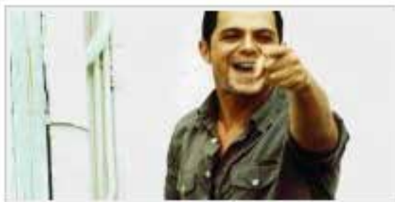
guapos latinos 2010